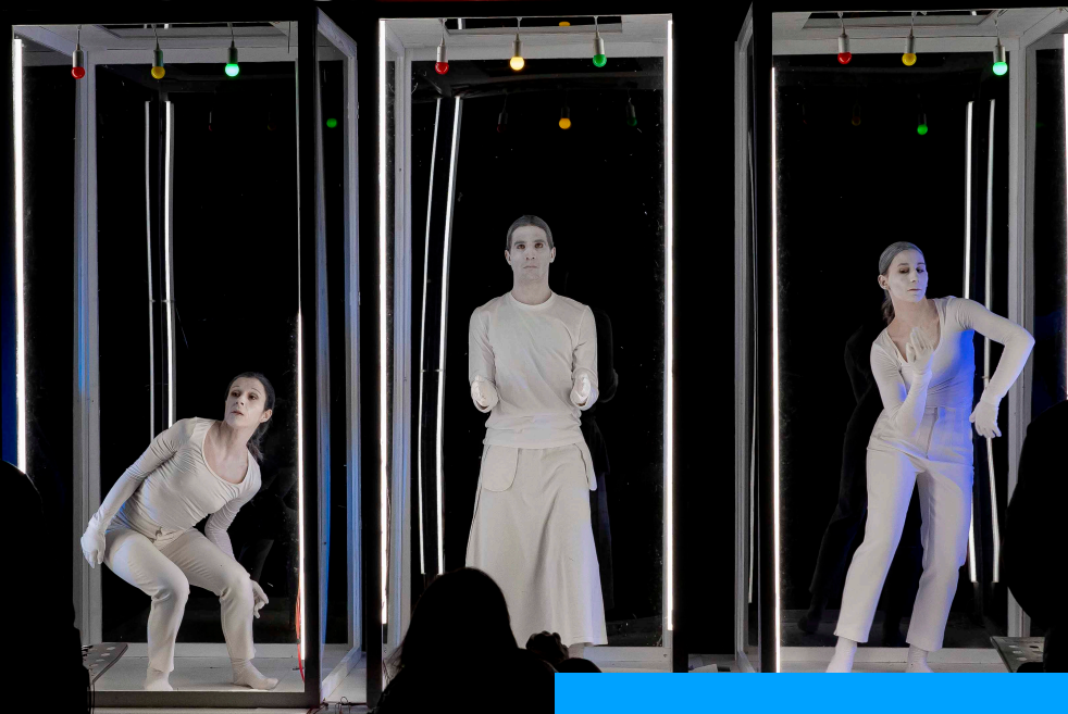
Trailer 2' - Entscheiden - Compagnia teatroBlu